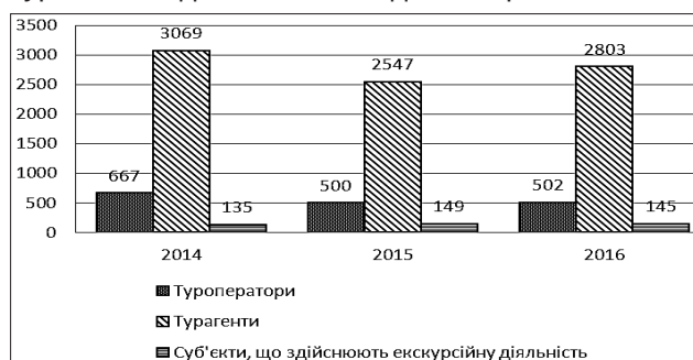
Рис. 3. Динаміка суб'єктів туристичної діяльності за 2014-2016 рр.

Кількість суб'єктів туристичної діяльності, за даними державної служби статистики України у 2016 році становила 552 туроператори, 2803 турагенти (з них 1222 зареєстровані як юридичні особи та 1581 – фізичні особи), 145 суб'єктів, що здійснюють екскурсійну діяльність (з них 64 юридичні особи та 81 – фізична особа) [5]. Порівняно з 2015 роком кількість туроператорів зросла на 2 особи (0,4%), кількість турагентів зросла на 256 осіб (10,1%), а кількість суб'єктів, що здійснюють екскурсійну діяльність зменшилася на 4 особи (2,7%). Порівняльну динаміку суб'єктів туристичної діяльності наведено на рис. 3.