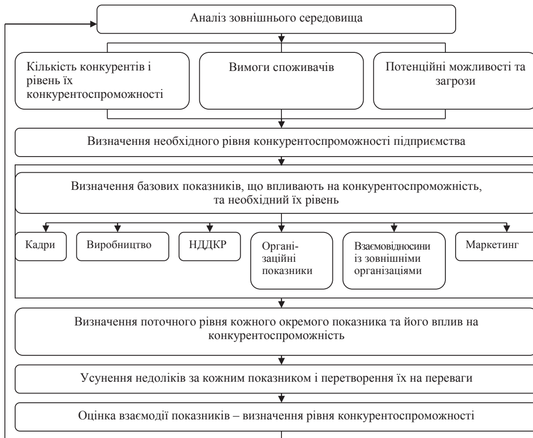
Рис. 1. Механізм забезпечення конкурентоспроможності підприємства*

Як видно з рисунку 1, даний механізм заснований на розробленій автором моделі вагів прийняття управлінських рішень щодо вироблення якісної чи фальсифікованої продукції з виділен-