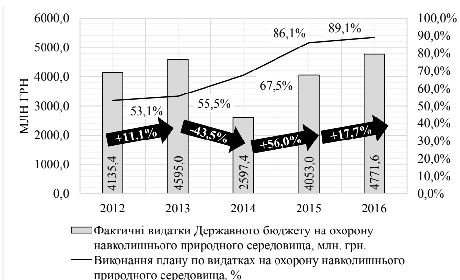
Рис. 1. Динаміка фактичних витрат Державного бюджету України на охорону навколишнього природного середовища та їх частка у планових показниках у 2012-2016 рр. [6]

Розглянемо детальніше динаміку видатків Державного бюджету України на охорону навколишнього природного середовища у 2012-2016 рр. (рис. 1): чіткої тенденції не простежується, най-