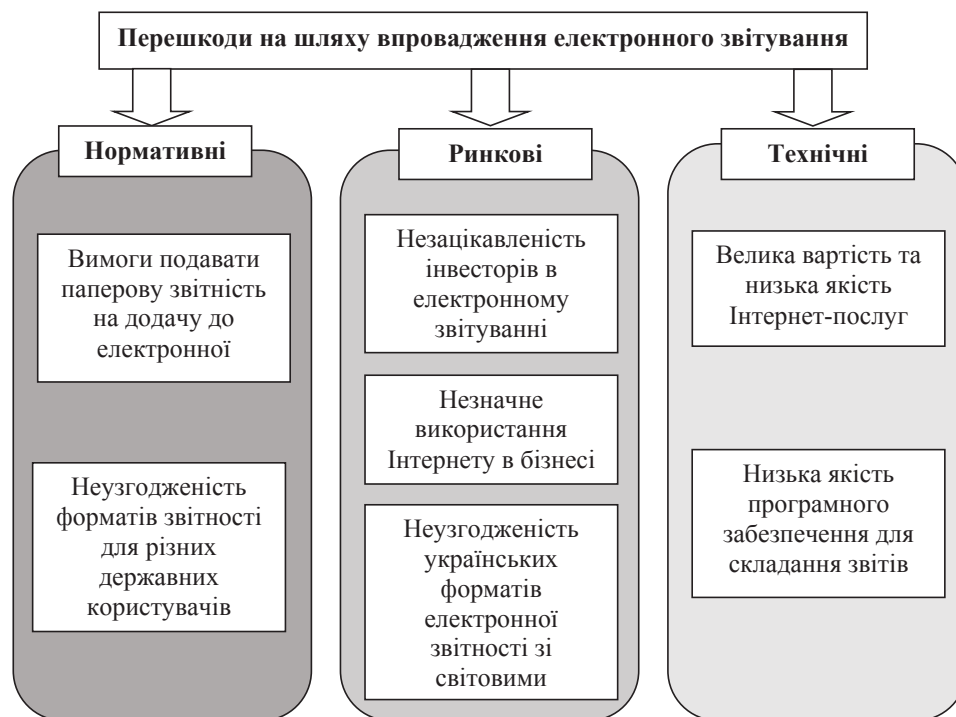
Рис. 2. Фактори, що гальмують впровадження електронного звітування в Україні [3; 9]

Карлова І.О. та Поліщук О.І. [5] зазначають, що державні органи вказують на зручність електро-