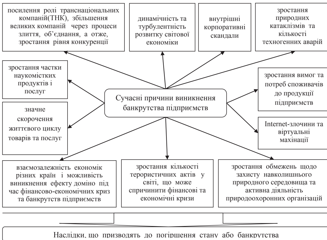
Рис. 2. Сучасні причини та наслідки банкрутства підприємств [8; 9; 14]