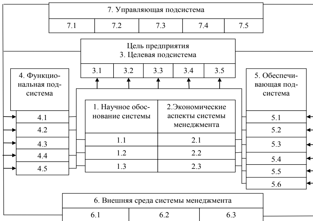
Рис. 1. Система менеджмента предприятия [3, с. 154]

Для характеристики различий сделаем еще некоторые пояснения. Менеджмент окружающей среды следует понимать как координирующее начало, формирующее и приводящее в движение ресурсы предприятия для достижения целей в сфере рационального природопользования, охраны окружающей среды и обеспечения экологической безопасности. Таким образом, менеджмент окружающей среды является подсистемой системы менеджмента, ориентированной на определенный объект (подобно кадровому, производственному или финансовому менеджменту). Объектом управления в данном случае становятся выбросы в атмосферу и сбросы в водоемы, потребление сырья, энергии и экологические последствия от произведенных предприятием продуктов. Для такого подхода характерны технологии обезвреживания загрязнения на последнем этапе производственного цикла (так называемые технологии «конца трубы»). В отличие от него, экологический менеджмент формирует и приводит в движение ресурсы предприятия для достижения экономических целей, которые в данном случае взаимосвязаны с целями рационального природо-