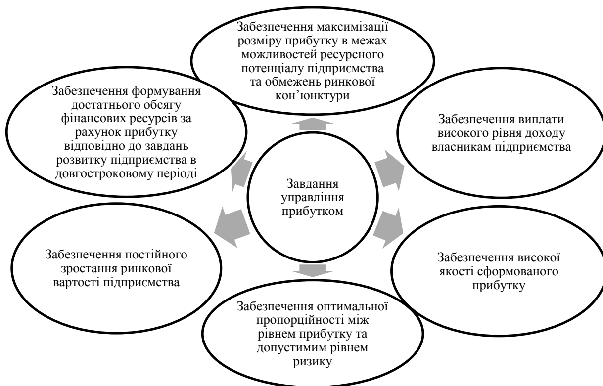
Рис. 1. Завдання управління прибутком

Принцип інтеграції із загальною системою управління підприємством передбачає узгодженість цілей системи управління прибутком і стратегічних цілей розвитку підприємства, адже процес управління прибутком охоплює всі аспекти діяльності підприємства та є результатом його фінансово-господарської діяльності.