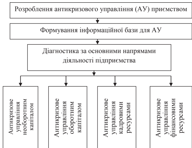
Рис. 1. Основні елементи та напрями формування антикризового управління підприємством

Діагностика використовується в системі антикризового фінансового управління для оцінки стану кризи у фінансовій сфері діяльності підприємства, визначення її глибини, виявлення слабких місць в управлінні підприємством та реалізації ефективного антикризового фінансового управління і подальшого впровадження методів подолання кризового стану. В.І. Фучеджи, спираючись на