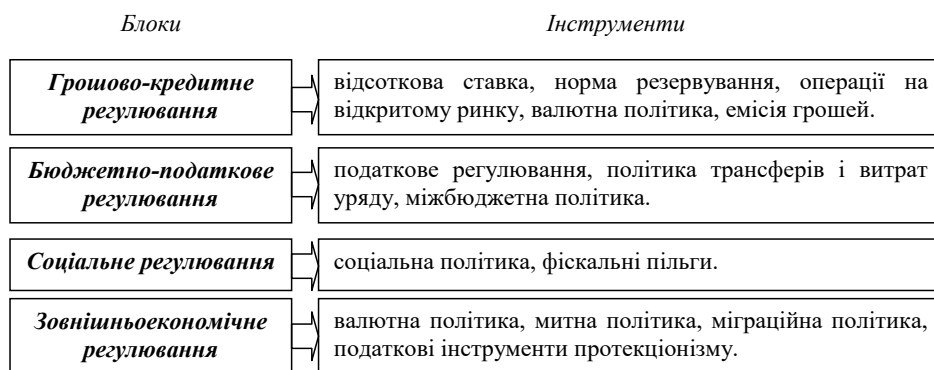
Рис. 1. Блоки та інструменти державного регулювання

Важливим в державному регулюванні національної економіки є визначення інструментів реалізації (рис. 1).