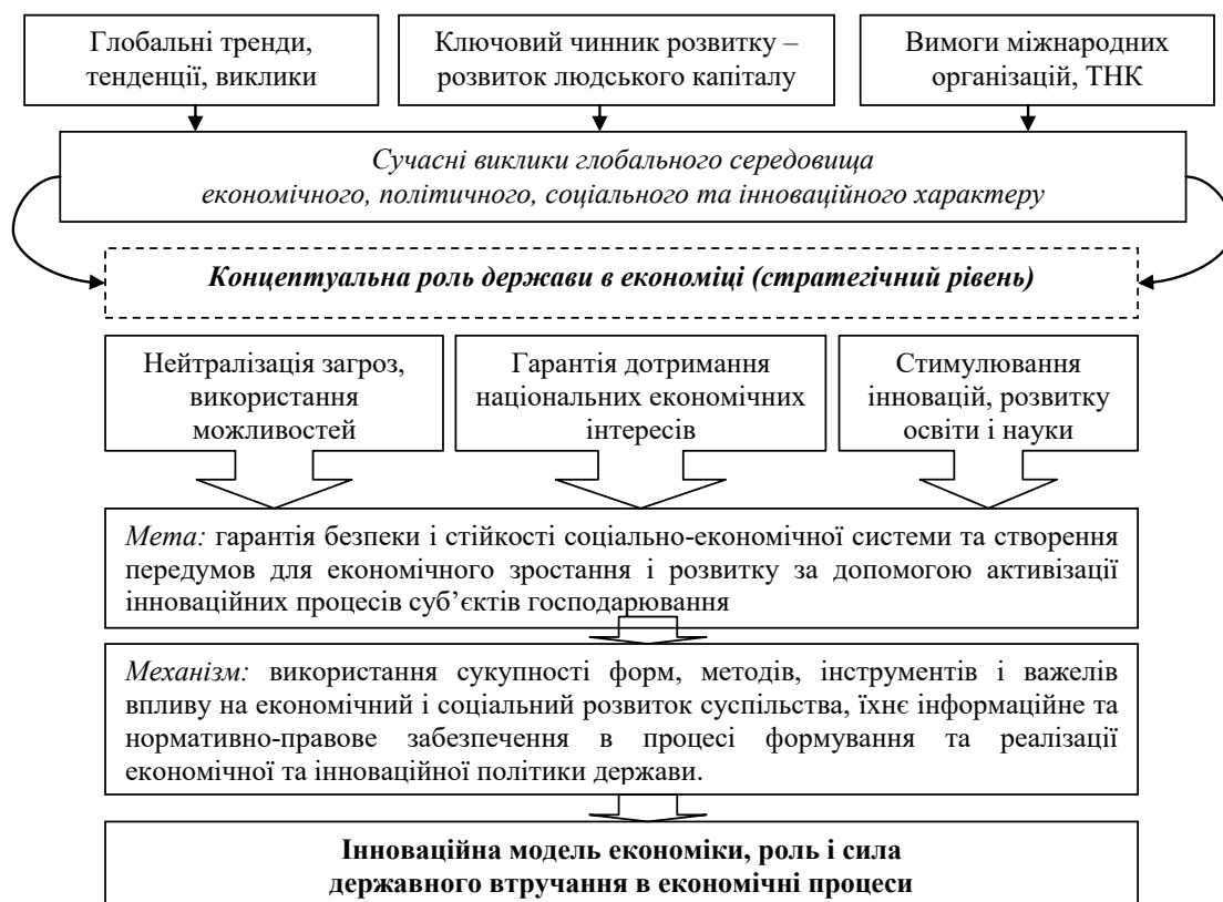
Рис. 3. Модель формування концептуальної ролі держави в економіці

процесів, за допомогою розроблення відповідної політики та інструментів, механізму її реалізації.