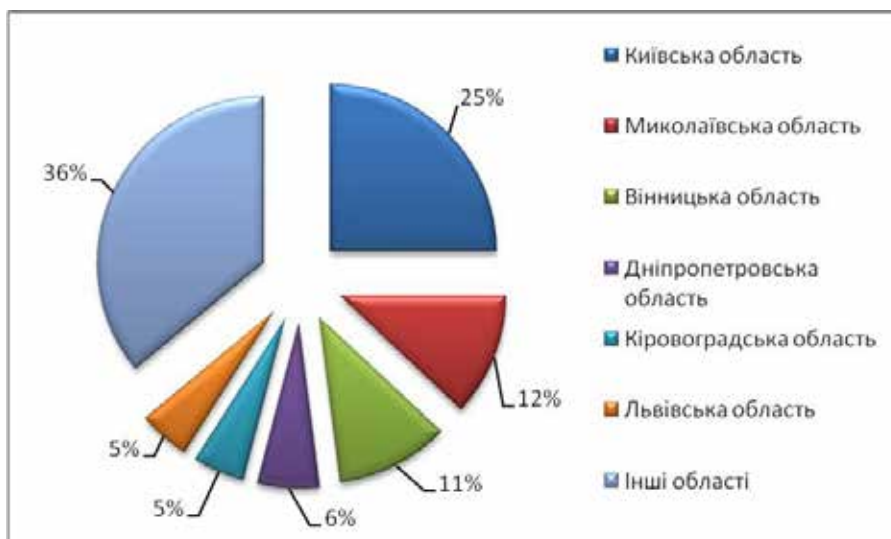
Рис. 1. ТОП областей України, жителі яких відвідували Одеську область у 2016 р., за даними «Київстар»