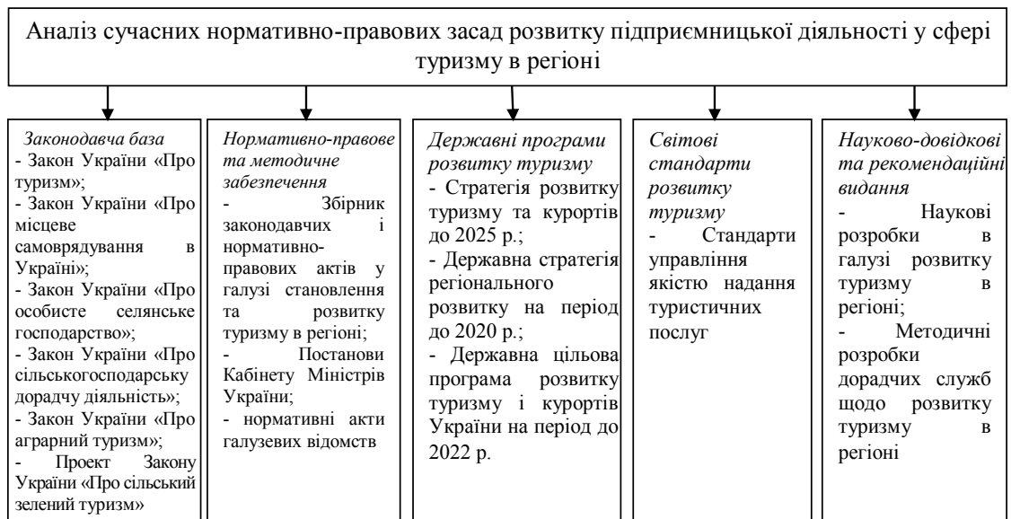
Рис. 2. Схема складових дослідження сучасних організаційно-правових засад розвитку підприємницької діяльності у сфері туризму

вітро-, геліо- та водоресурсного потенціалу сфери туризму тощо. На рівень економічної ефективності функціонування об'єктів туризму у Волинській області впливають соціально-економічні та інфраструктурні показники. Так, до основних проблем розвитку туризму більшості регіонів країни віднесено: