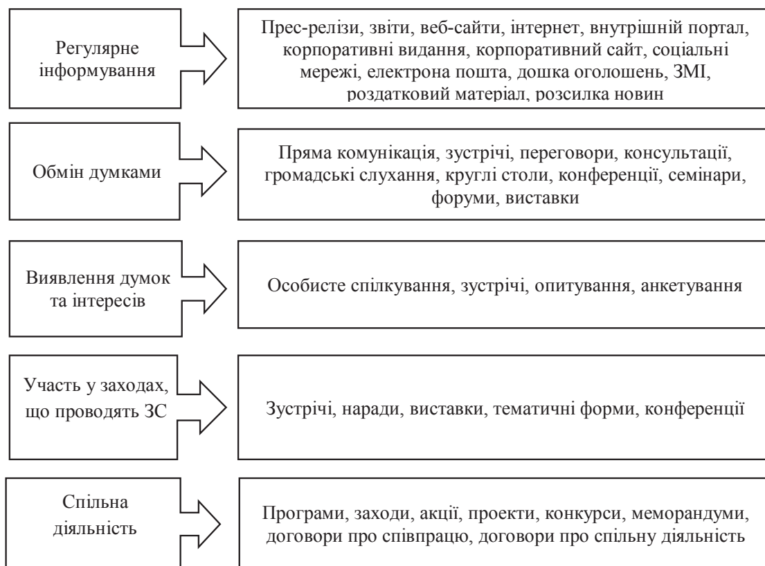
Рис. 2. Механізми взаємодії із зацікавленими сторонами