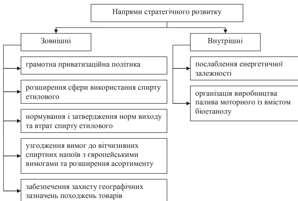
Рис. 2. Напрями стратегічного розвитку підприємств спиртової галузі

Таким чином, стратегічний розвиток підприємств спиртової промисловості в основному залежить від