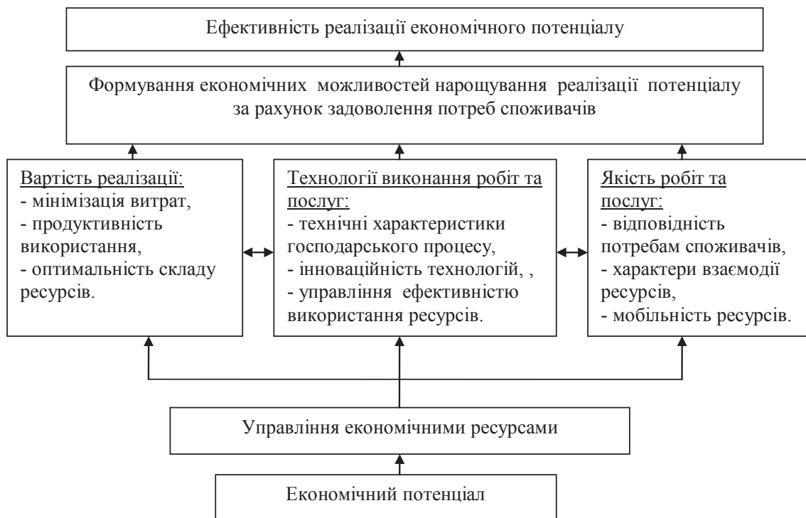
Рис. 3. Схема формування механізму забезпечення ефективності використання економічного потенціалу