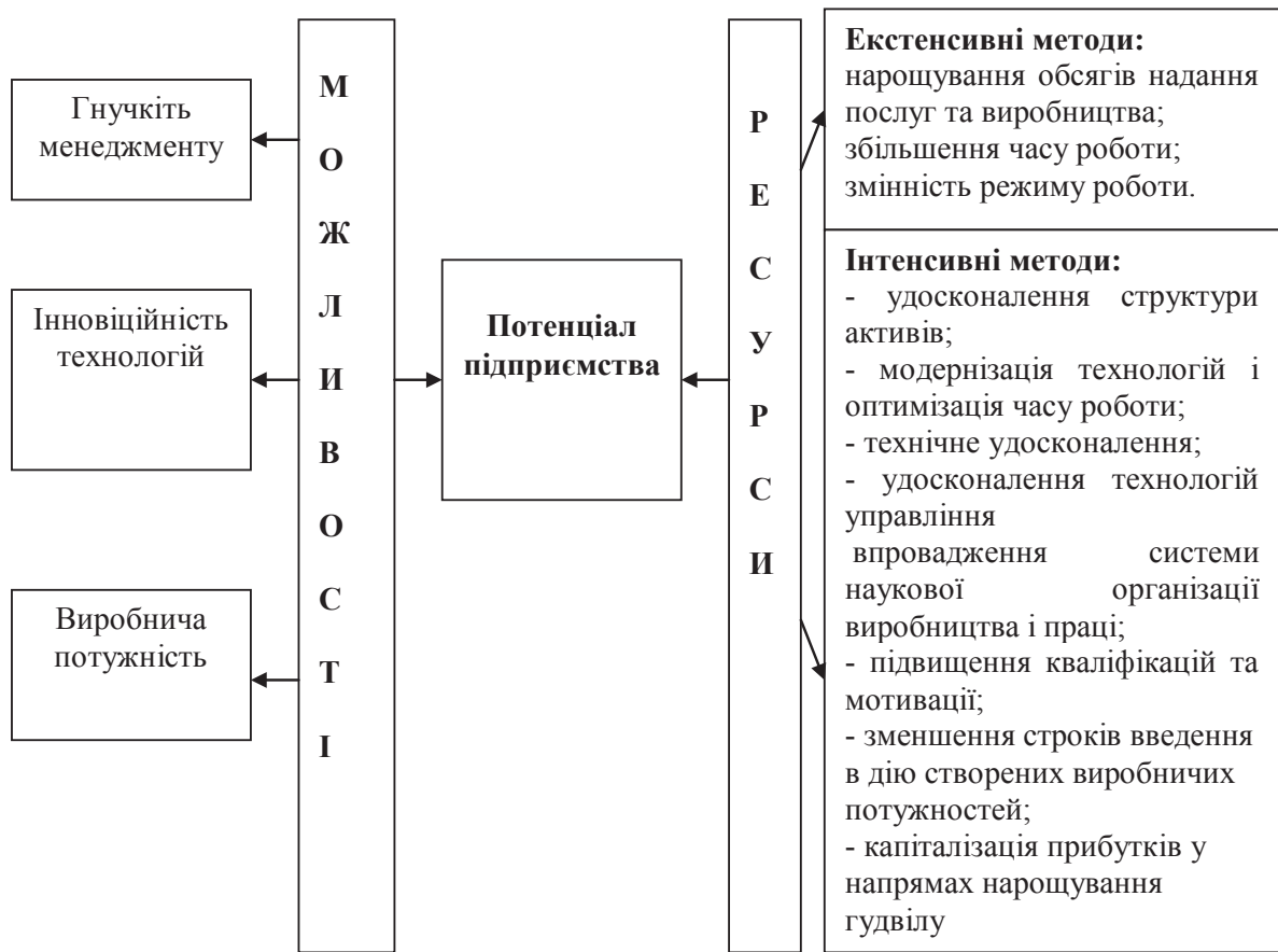
Рис. 2. Резерви підвищення ефективності використання економічного потенціалу авіапідприємства