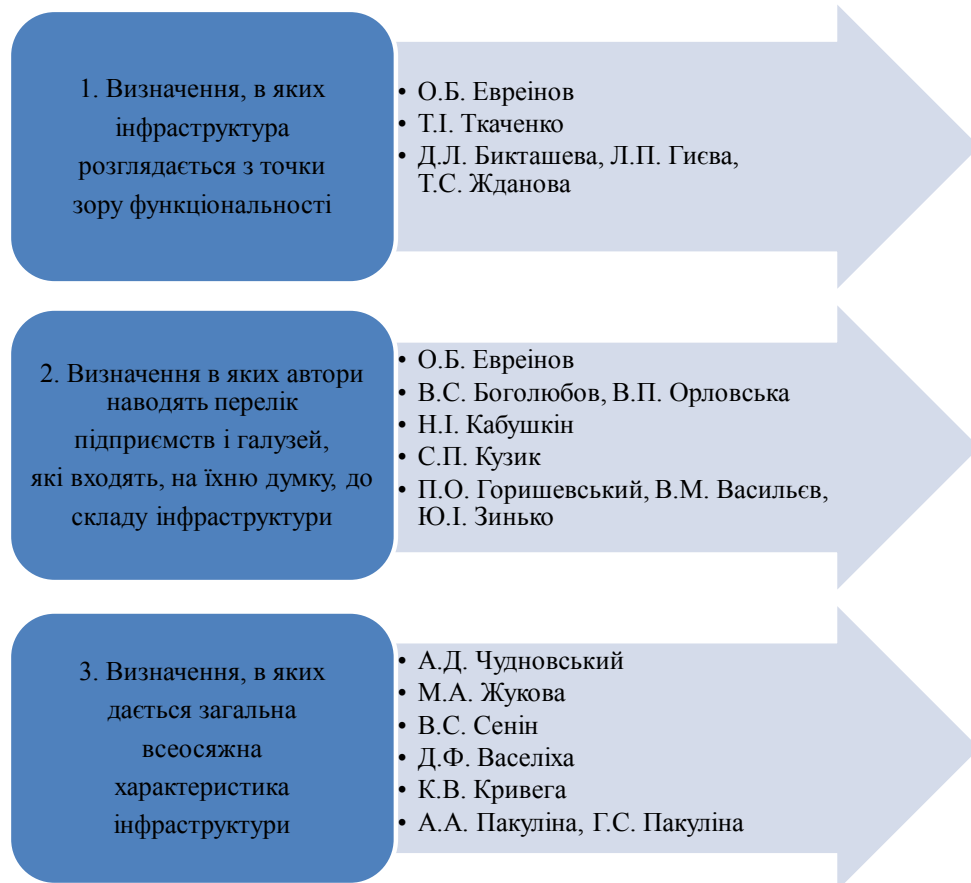
Рис. 1. Групи визначень поняття «інфраструктура туризму»

Проаналізувавши численні визначення поняття «туристська інфраструктура», в дослідженні будемо дотримуватись думки про те, що туристська інфраструктура – це сукупність підприємницьких (комерційних) та непідприємницьких (некомерційних) організацій, а також ресурсного потенціалу, які створюють умови для здійснення