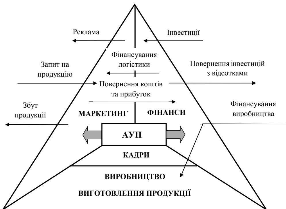
Рис. 2. Схема антикризового управління підприємством (АУП)

Під системою антикризового менеджменту розуміють спрямований вплив керівництва суб'єкта господарювання на його внутрішні організаційні процеси задля підвищення прибутку за рахунок зростання ефективності виробництва, якості продукції, економічного та соціального розвитку колективу [14]. Головними складовими сис-