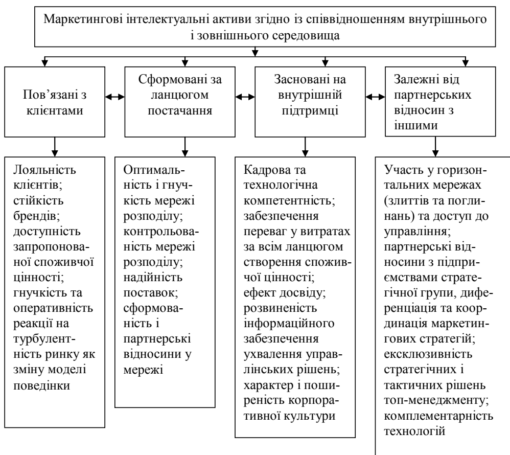
Рис. 1. Структура внутрішніх та зовнішніх маркетингових інтелектуальних активів

На основі проведених досліджень відповідно до тринадцяти робіт щодо визначення марочного капіталу у науковому колі запропонований [5] авторський погляд. Марочний капітал – це синтез