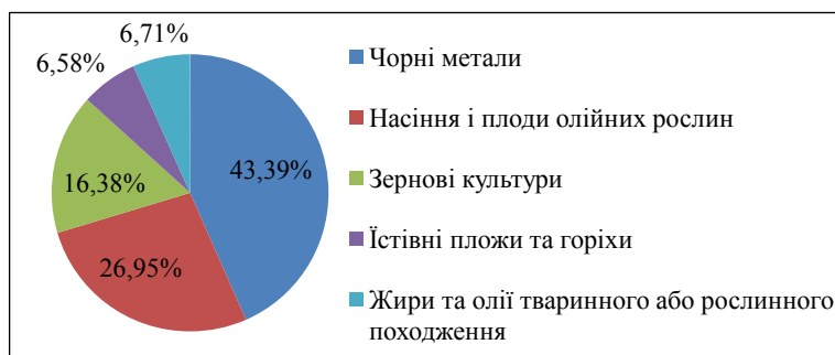
Рис. 1.1. Експорт українських товарів до Греції у 2017 р., %