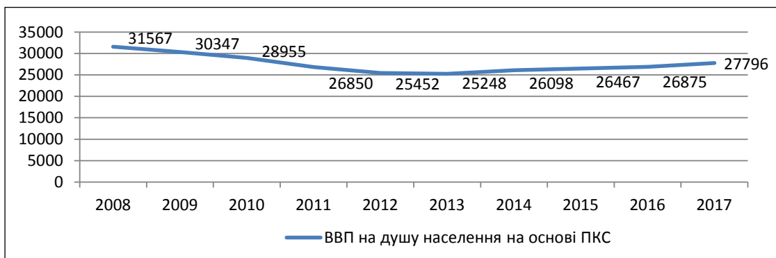
Рис. 1.4. ВВП на душу населення з урахування паритету купівельної спроможності, 2008–2017 рр.

Однією з ключових проблем підприємства у сфері організації збуту на зарубіжних ринках є від-