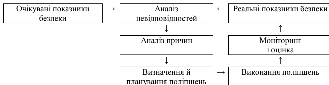
Рис. 3. Моніторинг безпеки на основі індикаторів