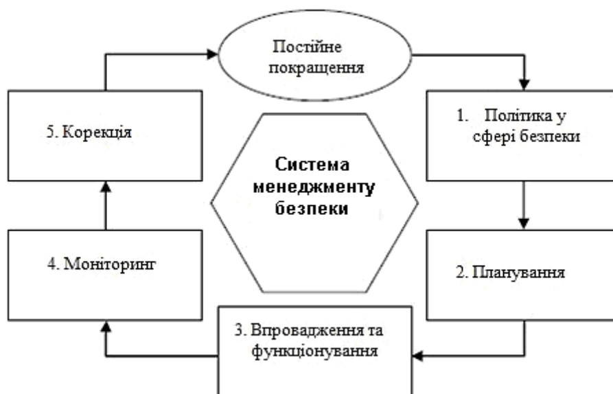
Рис. 1. Базові елементи системи менеджменту організації