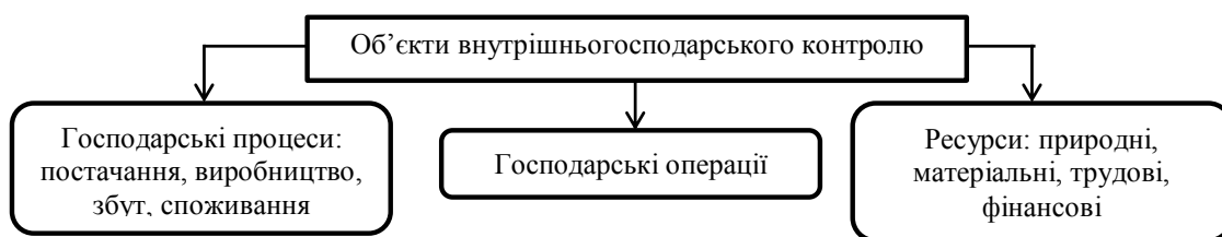
Рис. 1. Об'єкти внутрішньогосподарського контролю

Під організацією внутрішньогосподарського контролю необхідно розуміти процес упорядкування та налагодження системи внутрішньогосподарського контролю на підприємстві, який скла-