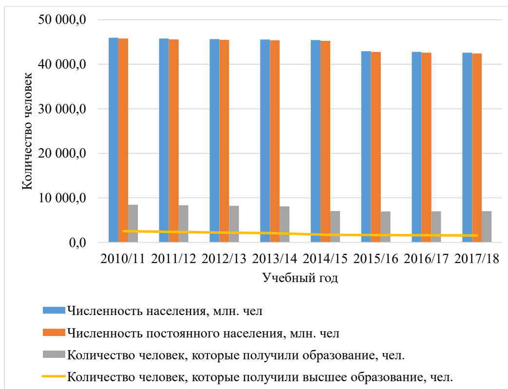
Рис. 3. Динамика количества лиц, получивших образование и высшее образование в Украине