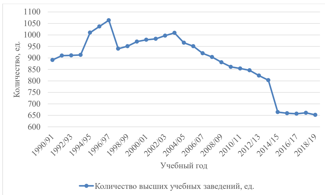
Рис. 1. Динамика количества высших учебных заведений в Украине

Резкое падение рождаемости, которое наблюдалось в Украине в первые годы независимости, привело к сокращению контингента выпускников средних общеобразовательных учреждений и, как следствие, к уменьшению количества абитуриентов, желающих получить высшее образо-