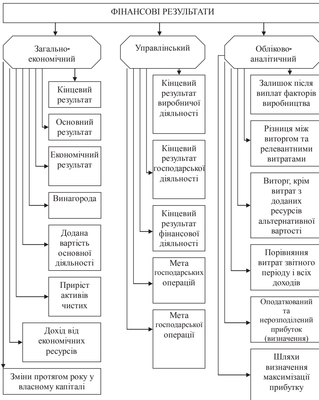
Рис. 3. Сектори вивчення фінансових результатів

Дійсно, іноді досить складно визначитися з одним чи двома (групою) методами, щоб дати найточніший та розгорнутий варіант розв'язку проблемного питання. Важливо пам'ятати, що для отримання точних якісних розрахунків доцільно застосовувати поетапний моніторинг уже отриманих результатів та поступово застосовувати комплексний системний підхід у подальших розрахунках. Зазначимо на рисунку 3 основні моменти, що потребують першочергового