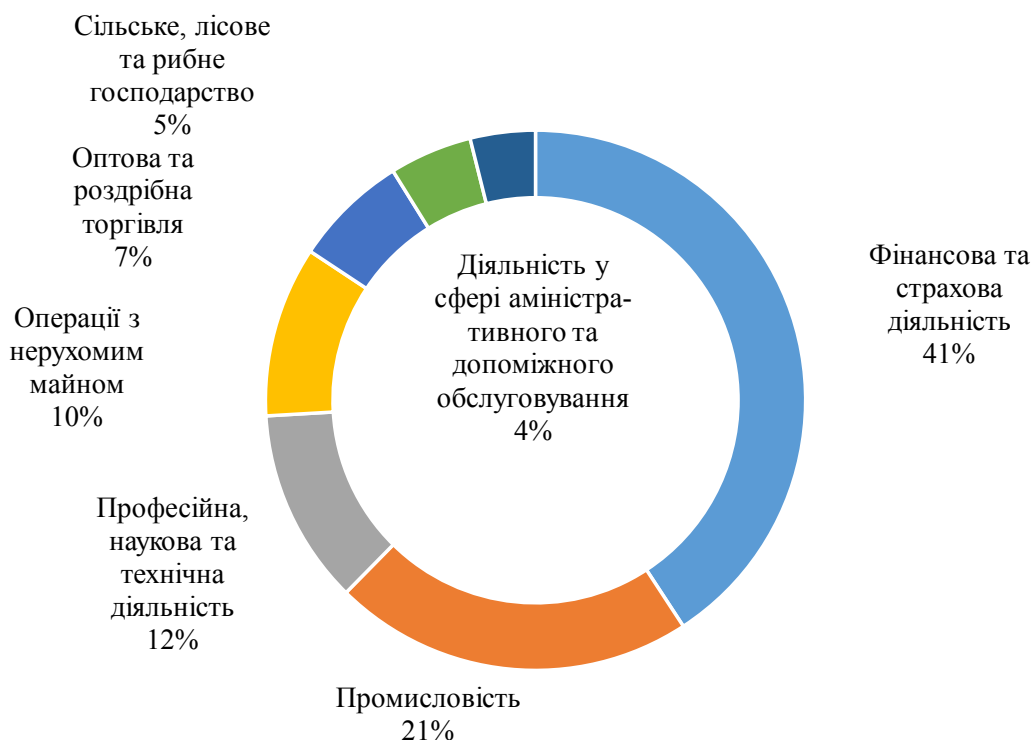
Рис. 3. Структура надходження прямих інвестицій (акціонерного капіталу) в Україну за видами економічної діяльності (найбільші обсяги) у 2019 р.,%

привабливість бізнес-середовища Вінницького регіону, який входить у ТОП-10 економічно розвинутих областей України (табл. 2). У 2018 р. Вінницька область залучила 4,5 мільярда гривень, втіливши у життя 34 інвестиційних проекти [4].