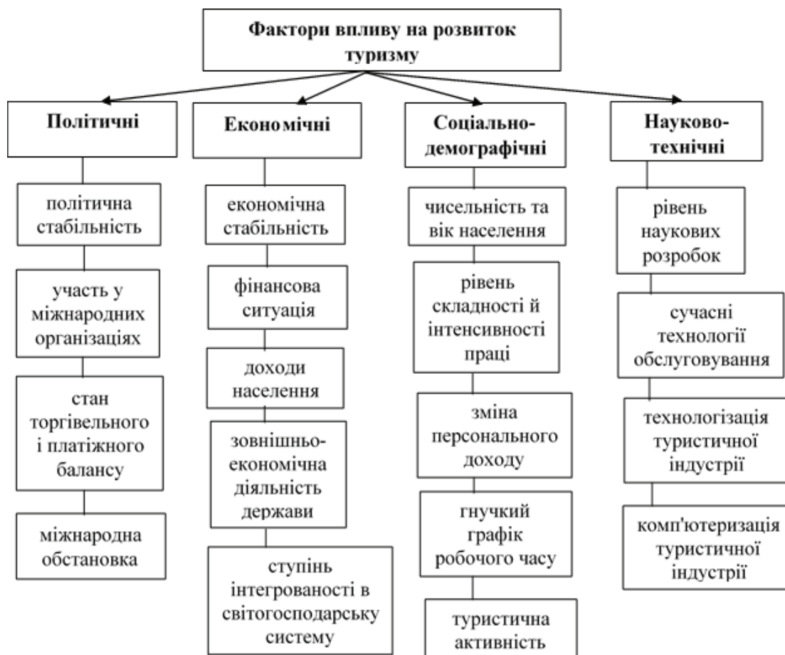
Рис. 1. Чинники впливу на розвиток туризму

Туризм займає важливе місце у структурі світового ВВП та зайнятості населення світу. За оцінками Всесвітньої ради з питань подорожей і туризму, частка туризму у світовому ВВП становить 10,4% [8]. У сфері туризму в 2018 р. працювало 319 млн. осіб (10% від зайнятих у світі), а доходи галузі останніми роками зростають швидше, ніж експорт товарів та світова економіка загалом. Туризм становить 29% світового експорту послуг [9]. Завдяки міжнародному туризму деякі