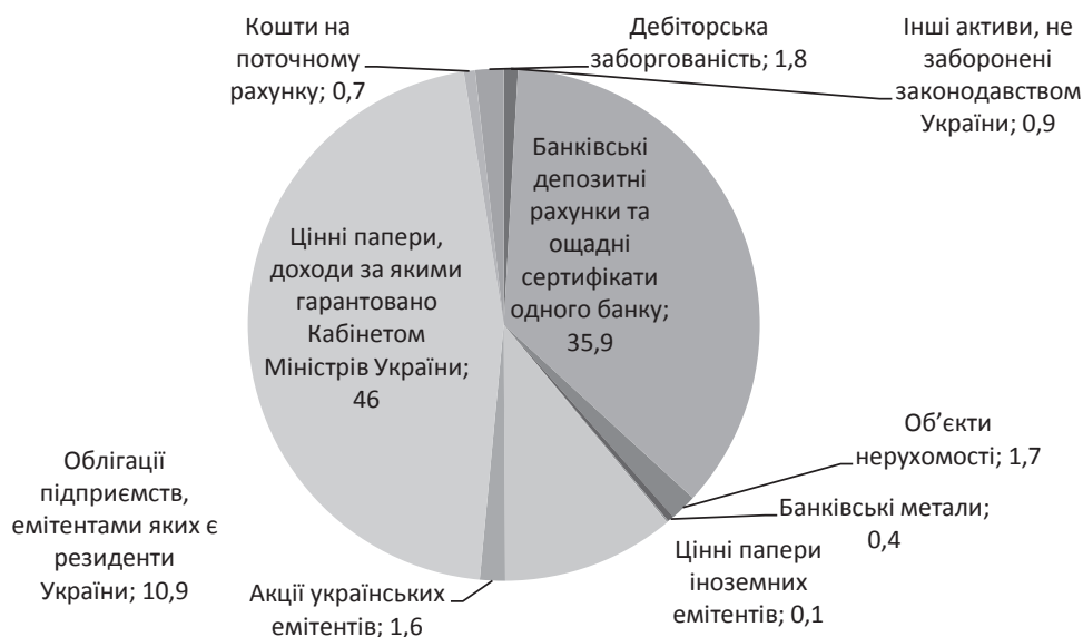
Рис. 3. Структура інвестованих пенсійних активів станом на 2018 р.,%

Основними проблемами, з якими зіткнулись НПФ на ринку фінансових послуг, є [7; 8]: