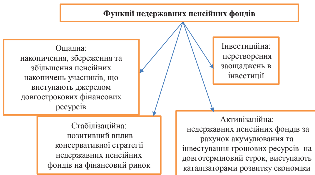
Рис. 1. Функції недержавних пенсійних фондів