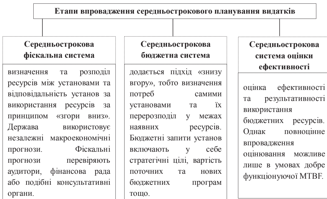
Рис. 2. Етапи впровадження середньострокового планування видатків