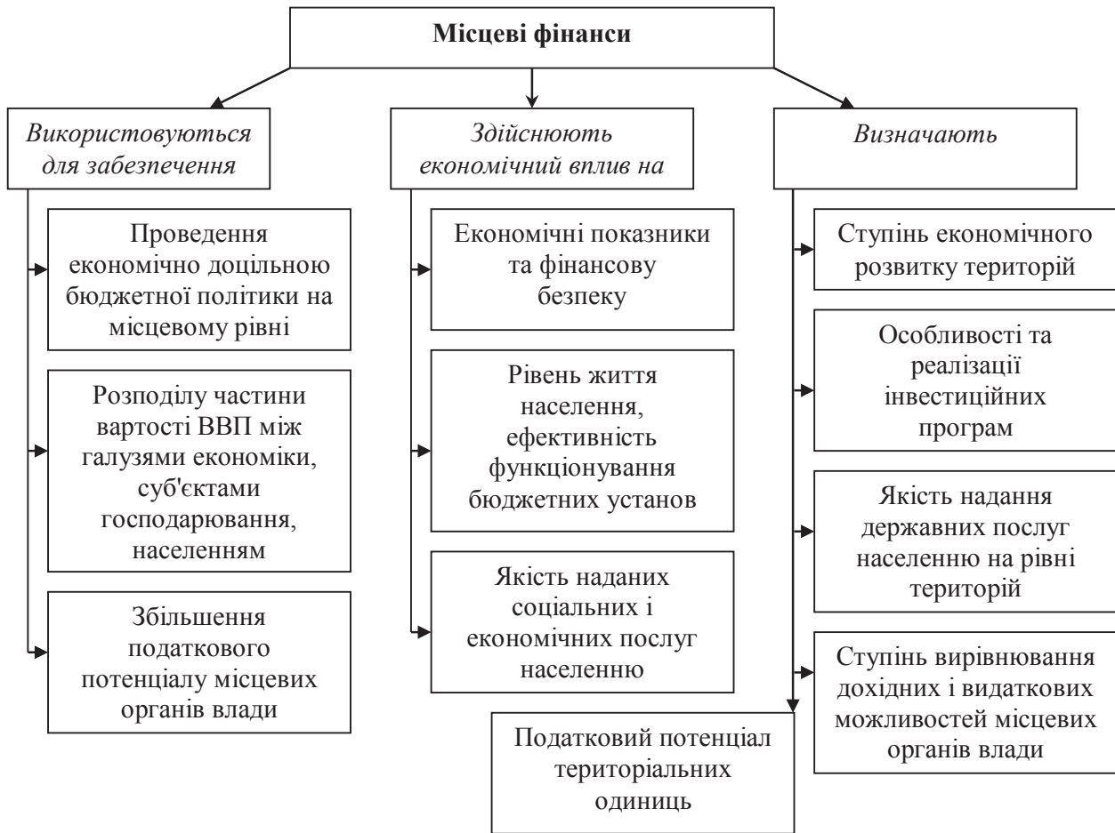
Рис. 2. Структурні складники економічної ролі місцевих фінансів

Подальший ефективний розвиток місцевих фінансів буде прямо залежати від обґрунтованості застосування методу програмно-цільового бюджетування на місцевому рівні, розвитку ринку муніципальних позик, реформування підприємств комунальної власності місцевих органів влади, впровадження обґрунтованих економічних показників та індикаторів оцінки фінансового стану й якості управління місцевими фінансами, стійкості місцевих бюджетів тощо.