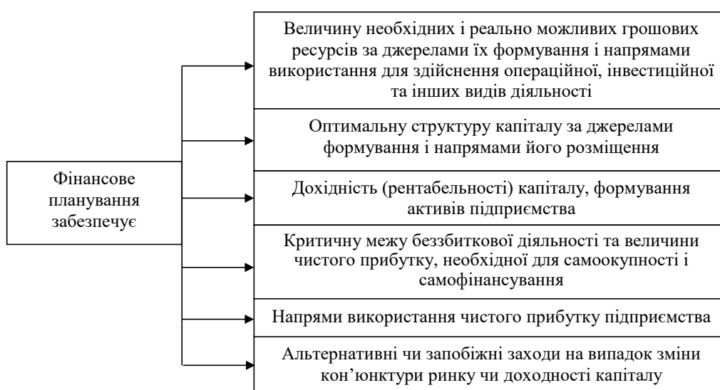
Рис. 2. Результати, які забезпечуються в процесі фінансового планування

Фінансове планування на підприємстві є складним процесом реалізації логічної послідовності заходів, спрямованих за досягнення поставлених цілей (стратегічних, тактичних та оперативних). Водночас процес фінансового планування на підприємстві не повинен завершуватися на етапі аналізу та оцінки реалізації планів. Остаточним етапом процесу фінансового планування є проведення коригуючих заходів, в основі яких лежить якісний та кількісний аналіз фактичних показників, порівняння їх із плановими, виявлення величини відхилення, аналіз чинників, які спричинили ці відхилення, а також розроблення відповідних заходів, спрямованих на створення більш точного та повного фінансового плану.