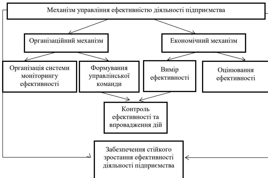
Рис. 2. Організаційно-економічний механізм управління ефективністю діяльності підприємства

Багато авторів вивчали це питання, формували власні схеми для впровадження механізмів. Проте головною їх помилкою є ігнорування впливу зовнішнього середовища на ефективність цього механізму, а також негативних наслідків його впровадження, тому необхідно розширити тривимірну оцінку до чотирьохвимірної категорією «аналіз впливу зовнішнього середовища на механізм» та категорій «розширення» й «ліквідація» у варіантах дій.