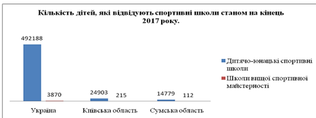
Рис. 2. Відвідуваність спортивних шкіл в регіонах України