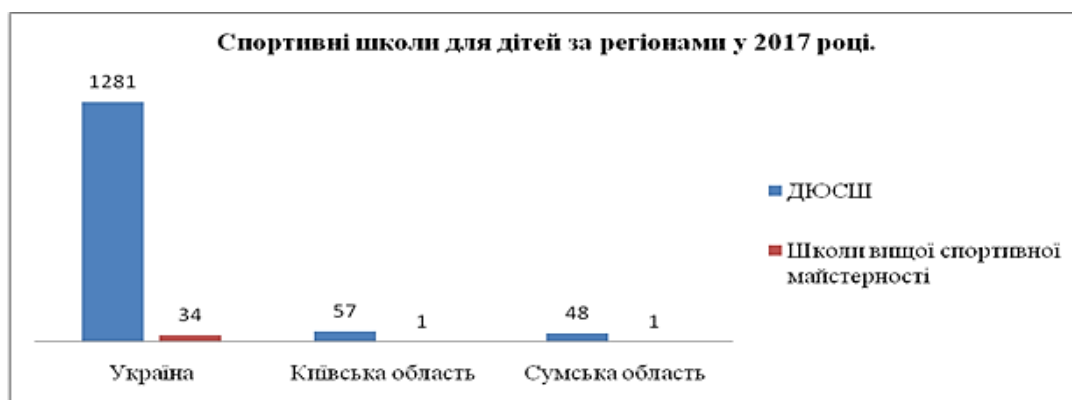
Рис. 1. Кількість спортивних шкіл в регіонах України

Висока значимість послуг фізичної культури й спорту вимагає вирішення проблем організаційно-економічного функціонування її інфраструктури. Актуальним є оцінювання її фактич-