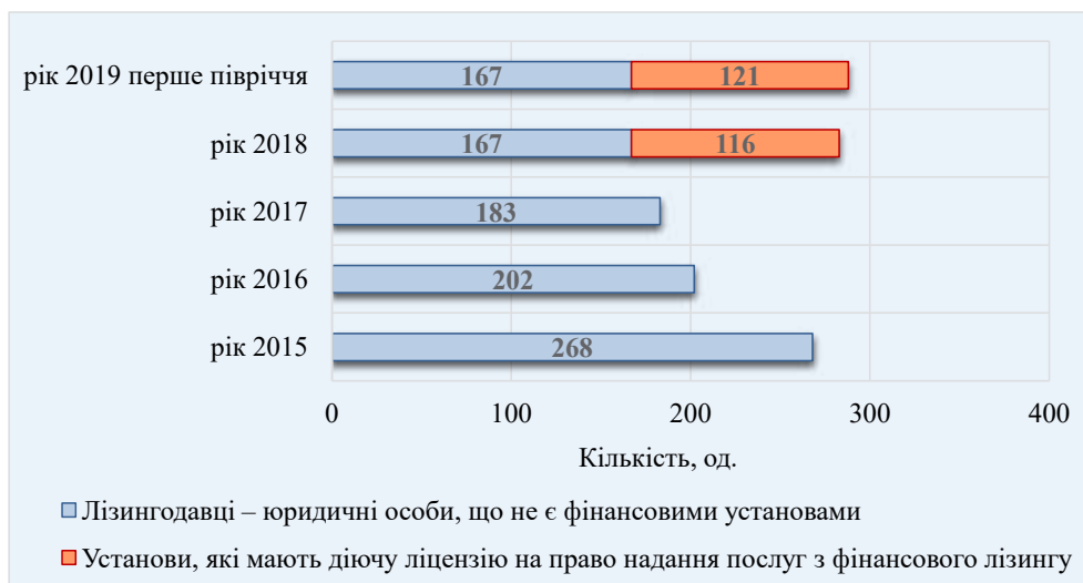
Рис. 3. Кількість лізингодавців, які здійснюють свою діяльність у сфері фінансового лізингу

Загалом за результатами 2018 р. фінансовими установами та лізингодавцями – юридичними особами, які не мають статусу фінансових установ,