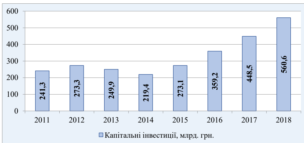
Рис. 2. Капітальні інвестиції за 2011–2018 рр.