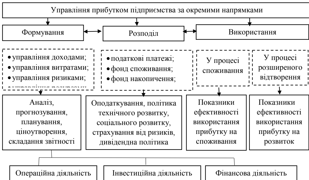
Рис. 2. Елементний склад об'єкта управління