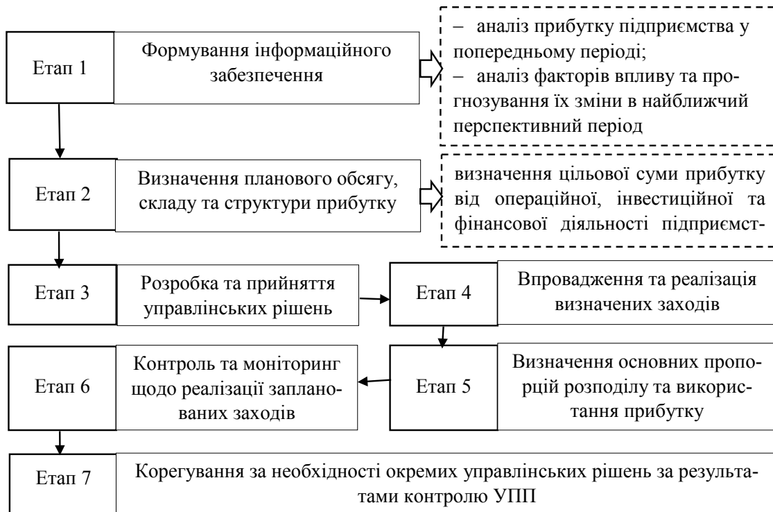
Рис. 3. Структурно-логічна схема процесу УПП

Політика управління розподілом та використанням прибутку передбачає формування дивідендної політики в акціонерних товариствах, що полягає в оптимізації пропорцій між капіталізованою частиною та частиною прибутку, яка