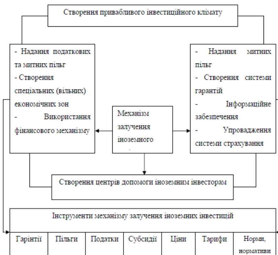
Рис. 2. Складові частини механізму залучення іноземних інвестицій

Специфічних заходів, які були зазначені вище, слід вжити для покращення інвестиційного процесу, який є в Україні сьогодні. За зубожіння держави з'являється необхідність створення прийняттого інвестиційного середовища для приватних інвесторів та інвестиційних фондів. Водночас