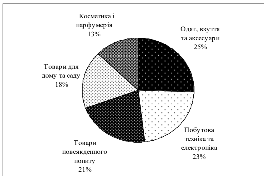
Рис. 1. Структура категорій товарів, що найчастіше купували українці у 2019 р.

Отже, найпопулярнішими категоріями українського e-commerce-ринку є одяг і взуття. При цьому