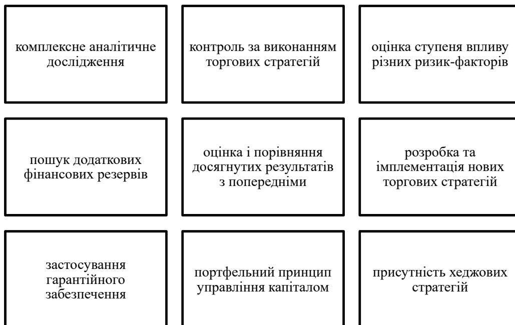
Рис. 1. Складники аналізу біржового ринку