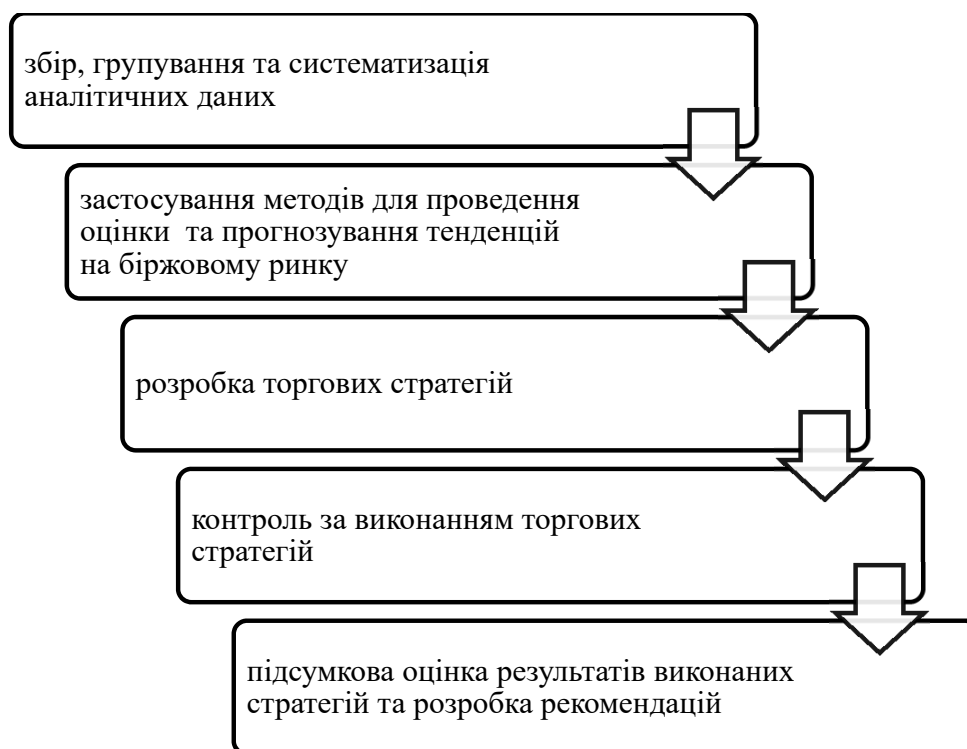
Рис. 2. Основні етапи проведення аналізу біржового ринку