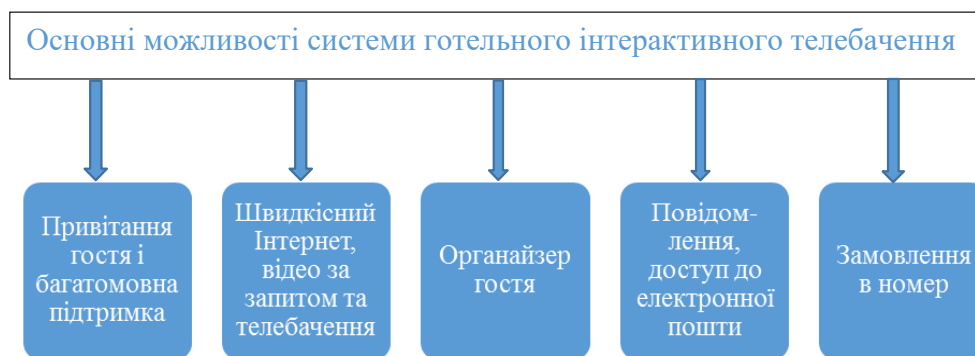
Рис. 1. Основні можливості системи готельного інтерактивного телебачення

супроводжуватися субтитрами. Інтерфейс системи інтуїтивно зрозумілий для гостей. Управління функціями системи не складніше, ніж управління пультом телевізора. В оформленні інтерфейсу можна застосовувати графічні зображення готелю: колір, товарні знаки, логотипи.