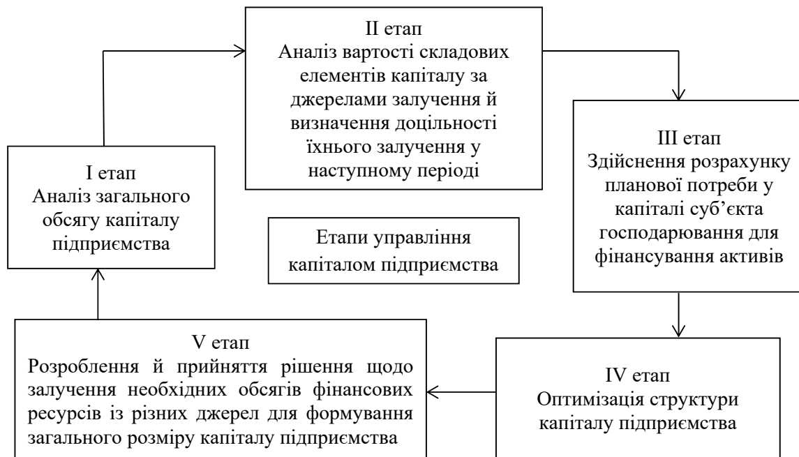
Рис. 3. Основні етапи управління капіталом суб'єкта господарювання

найбільш оптимального співвідношення складових елементів капіталу. Оптимальною є структура капіталу, яка передбачає таке співвідношення власних та позикових фінансових ресурсів, яке забезпечує найбільш оптимальне поєднання фінансового ризику та прибутковості й сприяє максимізації ринкової вартості підприємства.