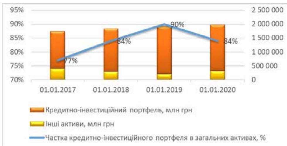
Рис. 1. Частка кредитно-інвестиційного портфеля банків України у їхніх загальних активах