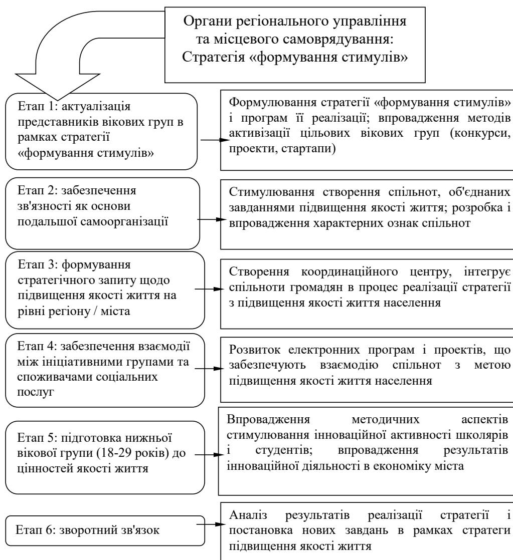
Рис. 3. Стратегія «формування стимулів» у межах державного механізму управління якістю життя населення з урахуванням окремих вікових груп