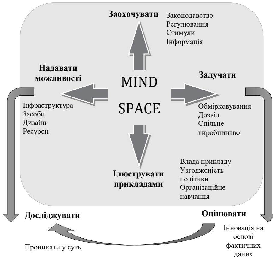
Рис. 2. Система 6Е для застосування інструментарію MINDSPACE [5]

регіонального управління та місцевого самоврядування, де процеси управління якістю життя мають чітке стратегічне цілепокладання і відображення в програмах територіального розвитку.