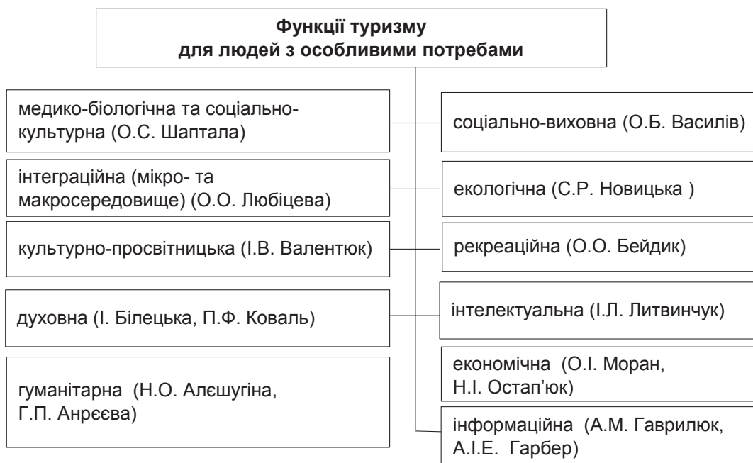
Рис. 2. Функції туризму для людей з особливими потребами

нової інформації, мати великі сучасні можливості в туристичному бізнесі. Віртуальність як процес асоціюють із моделюванням за допомогою комп'ютера. Віртуальний туризм – це онлайн- або офлайн-презентації, які дають змогу потенційним клієнтам розглянути будь-який туристичний об'єкт у вигляді широкоформатних або циркулярних (3600) типів турів, побачити панорамні об'єкти різних розмірів (експонати музеїв і картинних галерей, алеї парків, приміщення готелів, вулиці та будівлі міста і т. д.) [8].