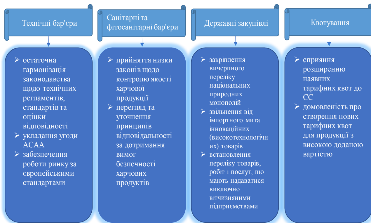
Рис. 3. Заходи з реформування системи нетарифного регулювання зовнішньої торгівлі України