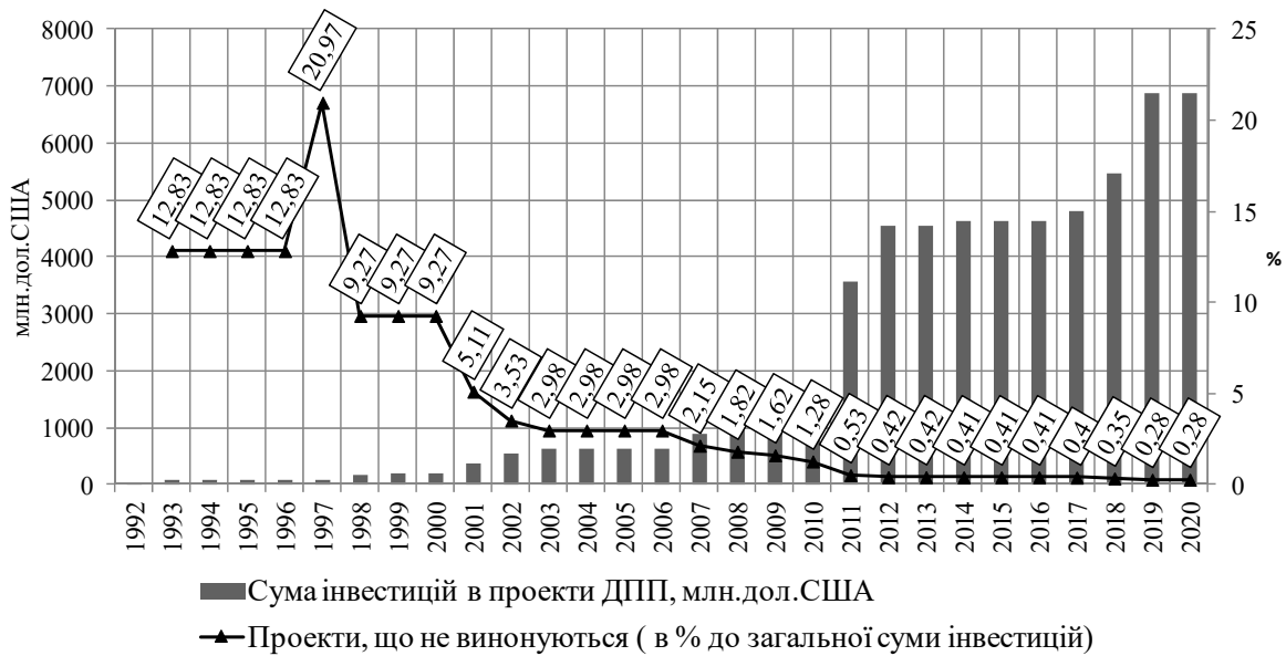
Рис. 3. Динаміка успішності проектів ДПП в Україні за даними Світового банку за 1992–2020 рр.