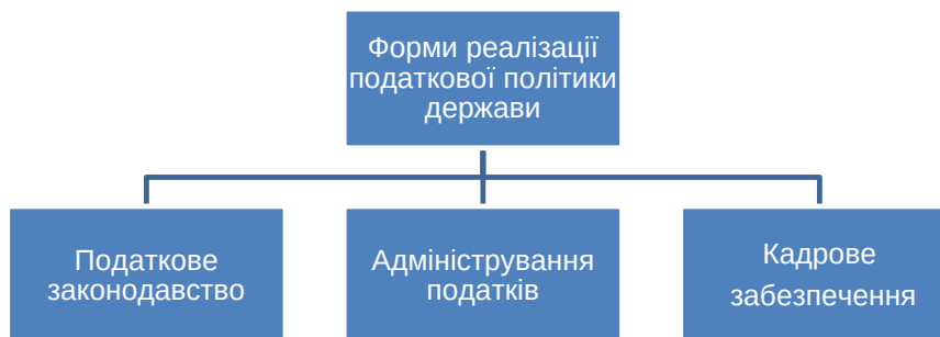
Рис. 2. Форми реалізації податкової політики держави