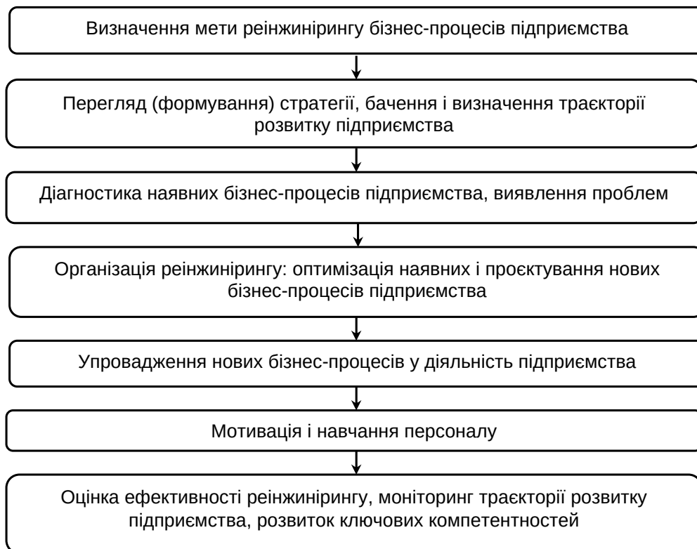
Рис. 3. Етапи проведення реінжинірингу бізнес-процесів

Беручи до уваги мотиви та цілі підприємства щодо проведення реінжинірингу бізнес-процесів, можна виділити три категорії підприємств, яким необхідний реінжиніринг: підприємства, які знаходяться у великій тривозі (ті, наприклад, які втрачають клієнтів, обсяг продажів, мають погані фінансові показники); підприємства, у яких поточна