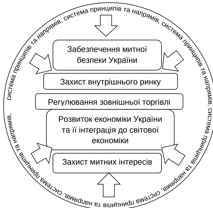
Рис. 1. Графічне зображення визначення «державна митна політика»

Як видно з наведеного поняття, під час реалізації митної політики використовуються механізми тарифного та нетарифного регулювання, що включають інструменти у вигляді митних платежів. Також прописано, що митна справа є відповідальною за правильність нарахування та сплати таких платежів.