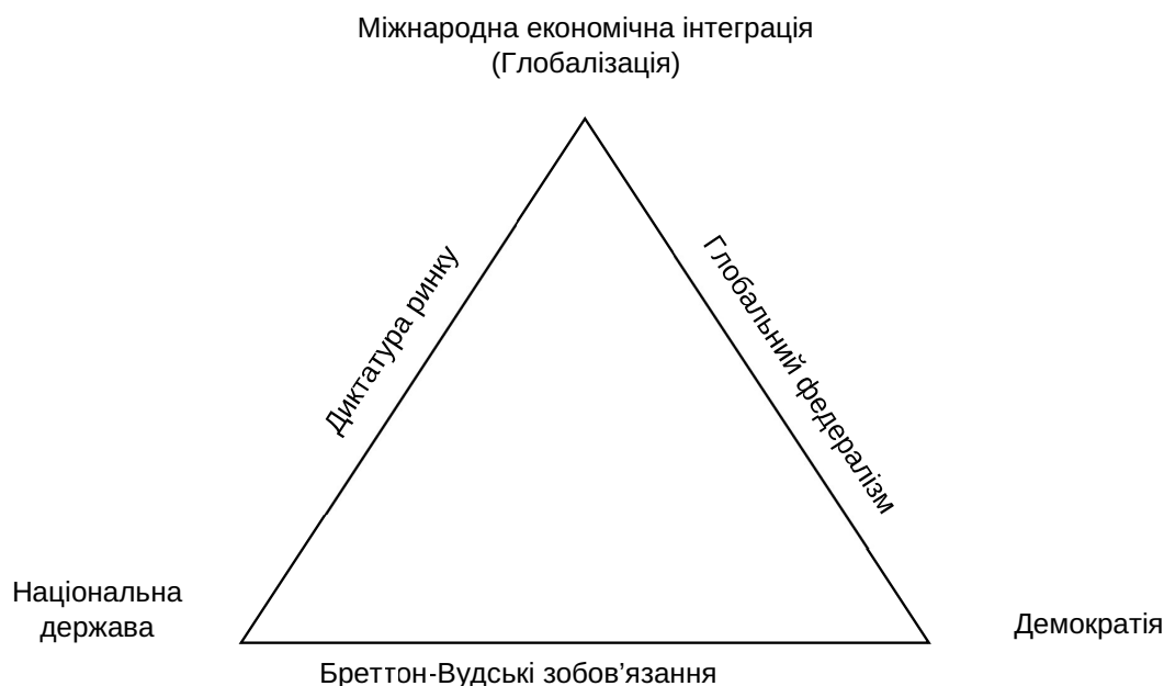
Рис. 3. Модель «Трилема глобальної економіки» за Д. Родріком

На підставі аналізу запропонованих варіантів та врахування тенденцій сучасного світового розвитку, слід зауважити актуальність подальшого