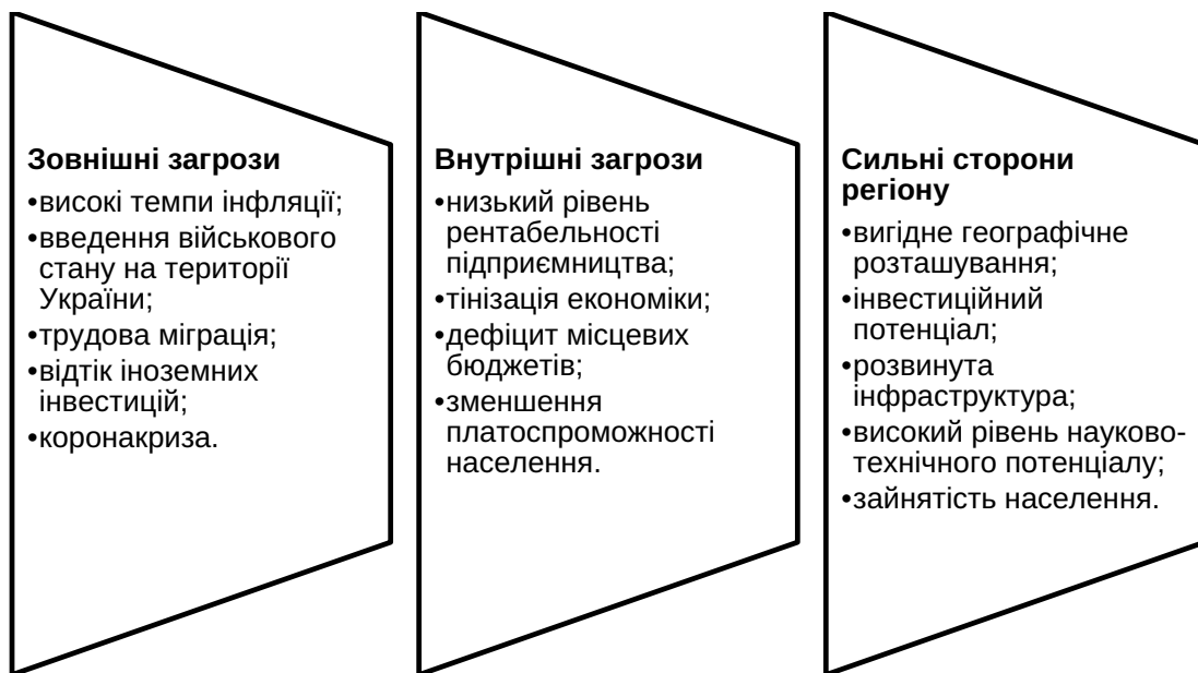
Рис. 2. Аналіз загроз та сильних сторін Львівського регіону