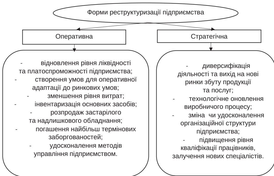
Рис. 1. Графічна інтерпретація форм реструктуризації підприємства

Метод оцінювання реструктуризаційної спроможності полягає у розрахунку певного набору фінансових коефіцієнтів із врахуванням вагових коефіцієнтів. Особливість даного методу полягає у тому, що він адаптований до особливостей та специфіки діяльності вітчизняних підприємств лісового господарства.