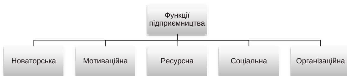
Рис. 1. Функції підприємництва

Під мотивацією підприємництва розуміється спонукання людини до впровадження