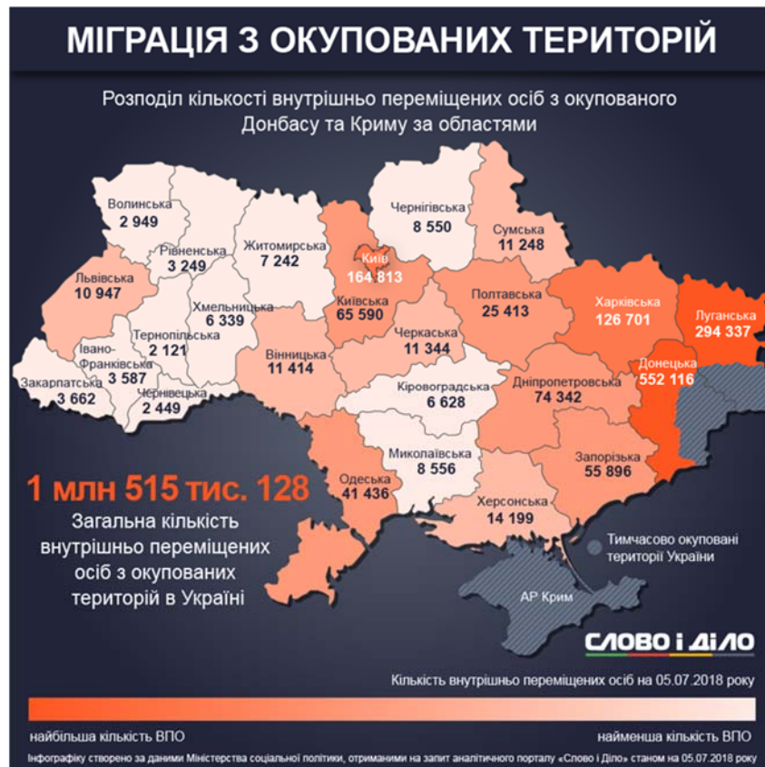
Рис. 1. Внутрішня міграція станом на 2018 рік

Це привело до змін в розподілі частки регіонів у ВВП України, що відображено в таблиці 1.